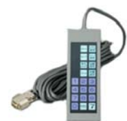
有線リモコン(付属)