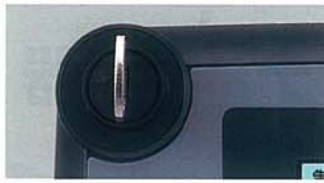
写真はキースイッチ

万が一に備え、プッシュロックターンリセットスイッチ（強制分離機構）を装備。また、キースイッチ（注文時対応可）により使用者の管理がおこなえます。