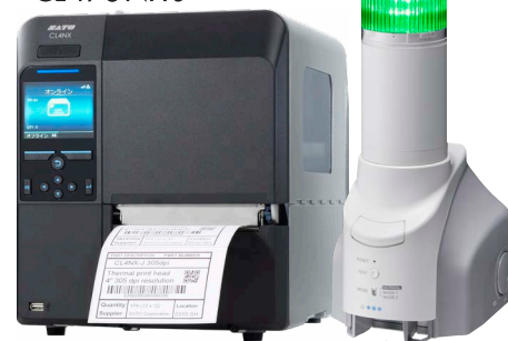
スキャントロニクス ® CL4/6NX-J

プリンタとパトライトをネットワーク接続することで、死角になりやすいプリンタの稼働状態をパトライトが通知。事務所や離れた場所からプリンタの状態を察知でき速やかな対処をすることでダウンタイムを削減します。