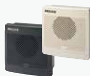
盤用MP3音声合成報知器 BKV ¥34,000~ DC AC 31ch 63φ