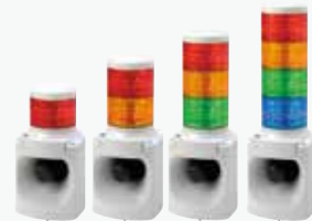
LED積層信号灯付きMP3音声合成報知器 LKEH-FV ¥50,000~ DC AC 31ch 63φ