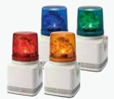
MP3音声合成内蔵LED回転灯 RFV ¥40,000~ DC AC 15ch 63φ