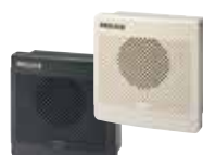
盤用MP3音声合成報知器 BKV DC AC 31ch 63円