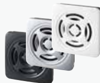
薄型MP3再生報知器 BSV ¥8,500~ DC 15ch 63φ