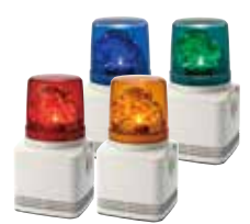
MP3音声合成内蔵LED回転灯 RFV DC AC 15ch 63円