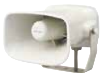
ホーン型MP3再生報知器 EHV AC DC 63ch 220円