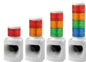
LED積層信号灯付きMP3音声合成報知器 LKEH-FV DC AC 31ch 63円