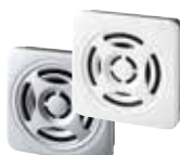
薄型MP3再生報知器 BSV DC 15ch 63円