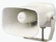
ホーン型MP3再生報知器 EHV ¥41,000~ AC DC 63ch 220φ