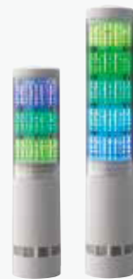
積層情報表示灯 LA6 ¥28,000~