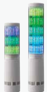
積層情報表示灯 LA6 ¥28,000~