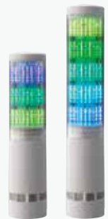
積層情報表示灯 LA6 ¥28,000~